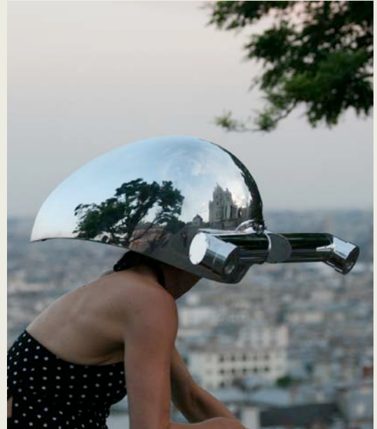
À QUOI RESSEMBLERAIT PARIS vu par un hypothétique requin-marteau installé en haut de la butte Montmartre ?